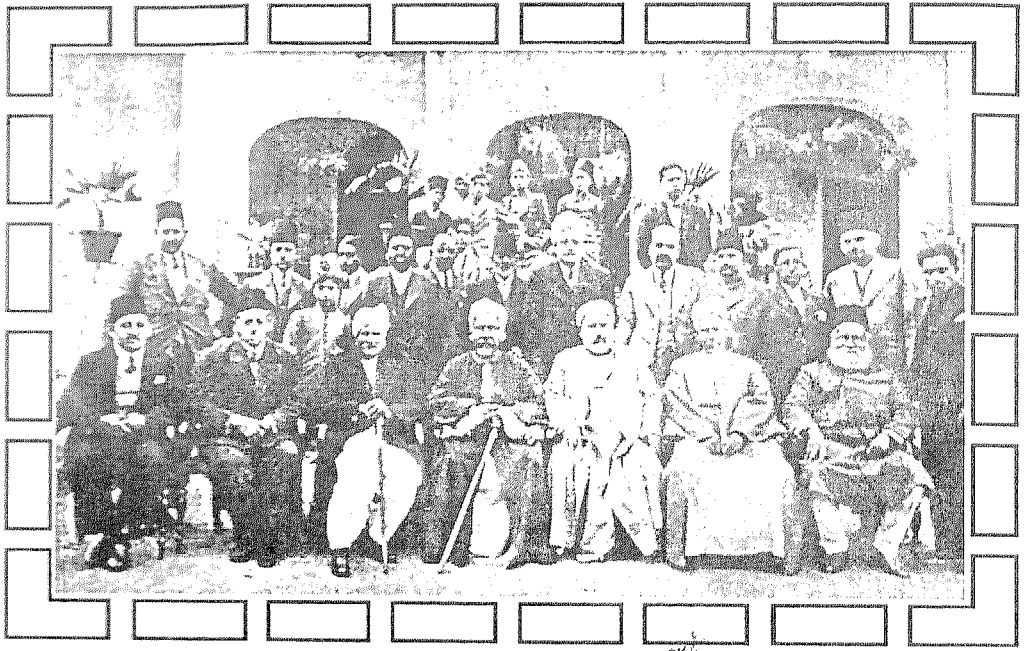
إقبال والوفد المصرى الأزهرى فى مدينة لاهور عام ١٣٥٦هـ / ١٩٣٧م